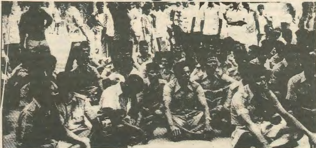
Αστυνομικοί κατά την απεργία του '79. Για να σπάσει η απεργία χρειάστηκαν οι σφαίρες του στρατού

Στις 18 του Αυγούστου 1982 η πλειοψηφία των αστυνομικών της Βομβάης — γύρω στις 22.000 — κατέβηκαν σε απεργία διαμαρτυρίας για τη σύλληψη 20 ηγετών της Συντεχνίας των Αστυνομικών και την απόλυση